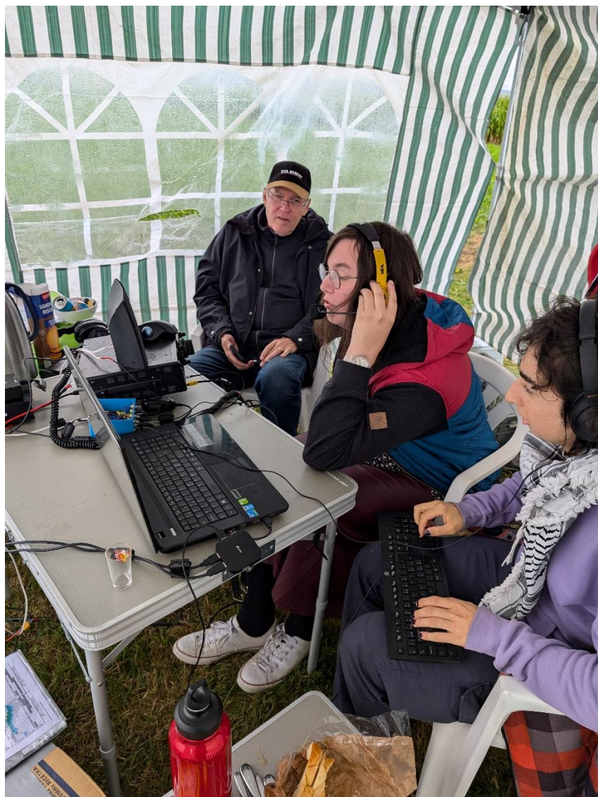
HB9GZB at the log, HB9HYL at the station, HB9IMG at the "blabla" as usual