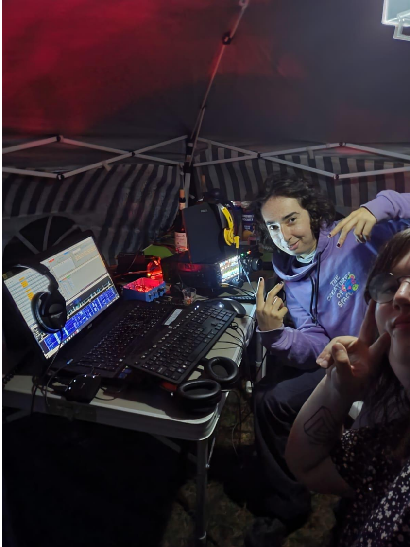
HB9HYL and HB9GZB, our girls night team during the rain and high wind period.

We all had a lot of fun and pleasure during the contest. Hope to see you next year.