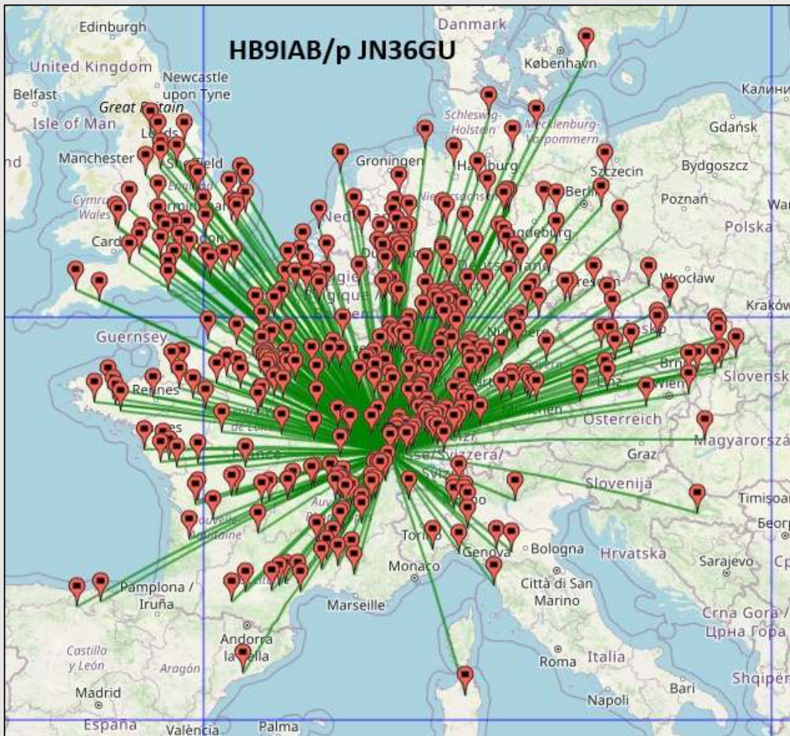
HB9IAB/p - Eric – JN36GU – worked stations 145 MHz